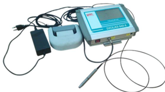
Рис. 2. Аппарат «Диолаз-940-6»

В УП «НТЦ «ЛЭМТ» БелОМО» разработан портативный полупроводниковый лазер для стоматологии, челюстно-лицевой и малоинвазивной хирургии со световодной доставкой излучения (рис. 2).