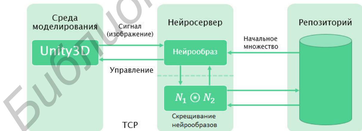
Рис. 3 – Архитектура системы нейроэволюции