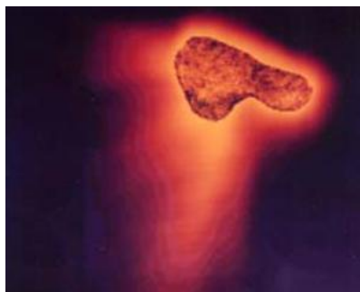
Рис. 3. Снимок ядра кометы Галлея