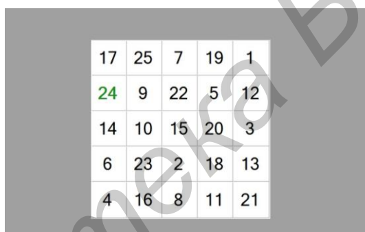
Рисунок 4 - Таблица Шульте (тест №4)

Результаты предварительных экспериментов сведены в таблицу 1