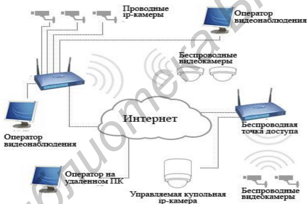
Рис. 3. Принцип работы системы IP-камер

На рис. 3 приводится принцип функционирования системы IP-камер.