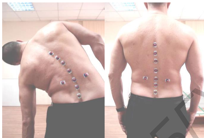
Рис. 1. Динамика движений пациента

Для выполнения наклона влево пациент из исходной позиции с максимальной комфортной скоростью наклоняется влево, скользя левой рукой вдоль бедра (насколько возможно, без ротации и наклонов вперед и назад), до ощущения боли или достижения максимально возможного объема движений в этом направлении. Затем пациент медленно возвращается в исходную позицию. После этого он выполняет наклон вправо аналогичным образом (рис. 1).