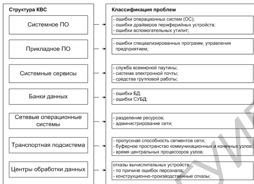
Рис.1 – Классификация проблем сопровождения КВС.

Основываясь на структуре КВС, можно сделать вывод, что для каждого уровня характерны свои особенности функционирования подсистемы, свои типы ошибок, возникающих при сопровождении и соответственно свой класс специалистов, решающих эти проблемы. Невозможность сопровождения КВС одним специалистом так же существенно повышает стоимость сопровождения КВС.