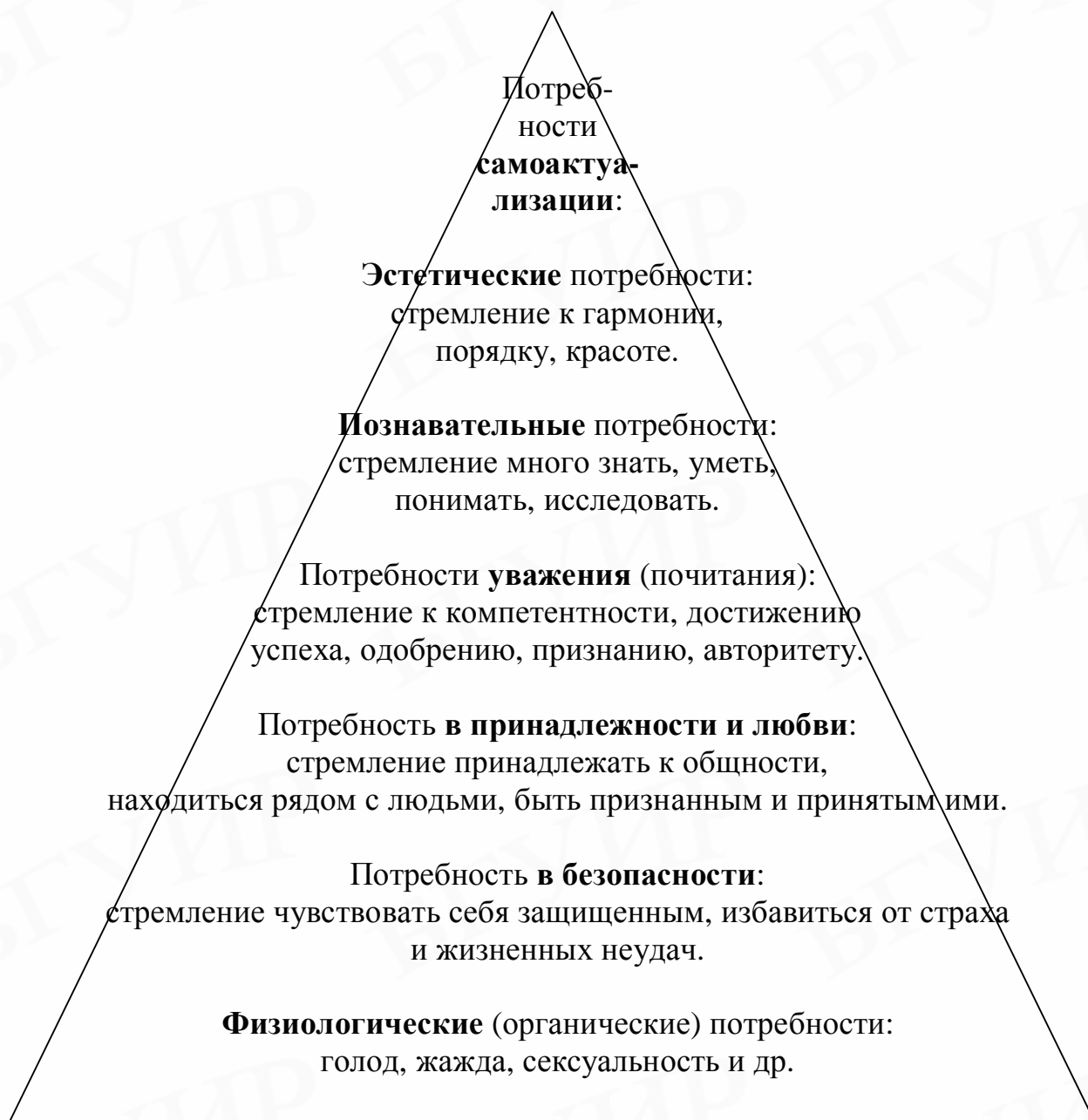
Рис. 1. Структура личных потребностей человека (по А. Маслоу)

Потребность в самоактуализации – стремление к реализации своих способностей, к развитию собственной личности, это «желание соответствовать собственной природе», быть тем, кем ты можешь быть, стремление заниматься тем, к чему предрасположен.