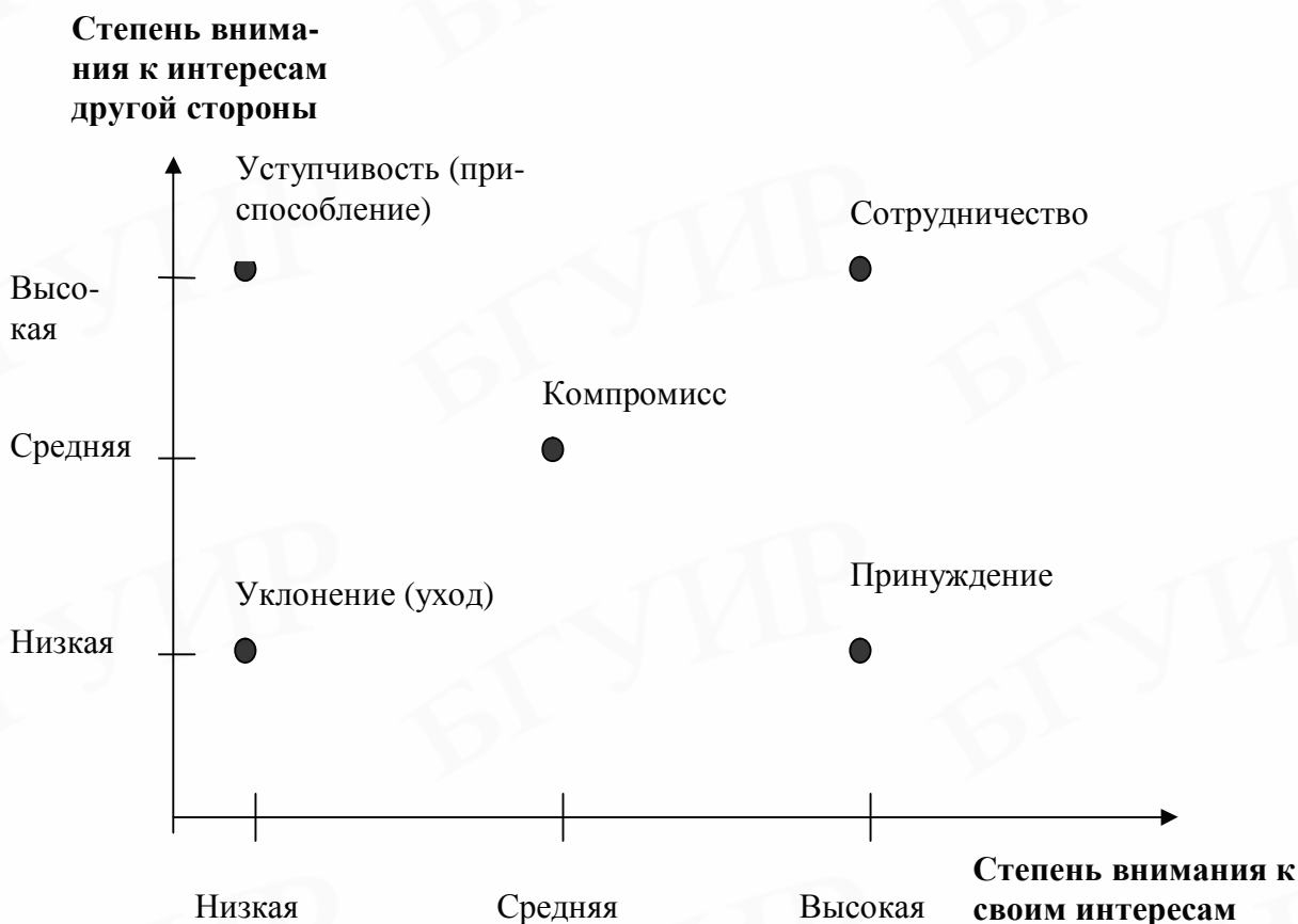
Рис. 5. Стратегии поведения участников конфликта

Иными словами, процесс возникновения непреднамеренного конфликта можно представить в виде следующей схемы (рис. 6).