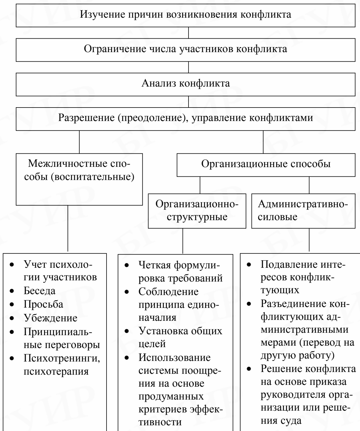
Рис. 4. Действия руководителя и способы разрешения конфликтов

Межличностные способы управления конфликтами представляют собой реализацию той или иной стратегии поведения участников конфликтной ситуации.