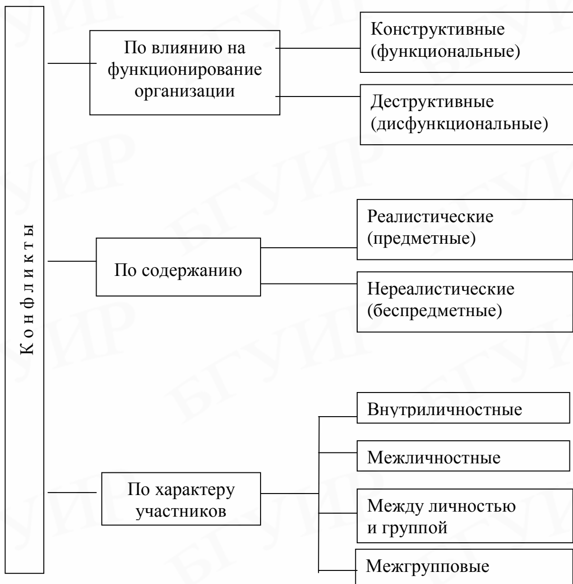
Рис. 3. Виды конфликтов

Выделяют следующие основные функциональные последствия конфликтов для организации.