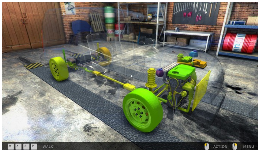
Рис. 1- Фрагмент видеофильма, показывающий работу симулятора сборки автомобиля из предлагаемого перечня деталей

Сегодня симуляторы применяются для обучения пилотов, для получения первоначальных навыков вождения, в медицине и других областях. В учебном процессе особенно полезным такой опыт будет для учащихся заочной и дистанционной формы обучения.