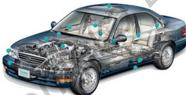
Рис.1 - Моделирование легкового автомобиля для краш-тестов

Современное компьютерное моделирование давно сделало шаг вперед в своем развитии, позволяя с феноменальной точностью воссоздать любое явление или процесс, будь то построение дома или краш-тест, моделирование которого является основной темой нашего доклада.