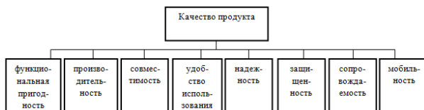
Рисунок 3 – Модель качества продукта

Так как одним из характерных признаков ИИС является способность к самообучению, можно утверждать, что ИИС является постоянно развивающейся системой. Значит, для ИИС больший интерес имеет модель качества продукта (рисунок 3), нежели модель качества в использовании.