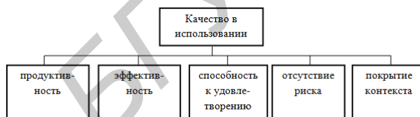
Рисунок 2 – Модель качества в использовании

Так как одним из характерных признаков ИИС является способность к самообучению, можно утверждать, что ИИС является постоянно развивающейся системой. Значит, для ИИС больший интерес имеет модель качества продукта (рисунок 3), нежели модель качества в использовании.