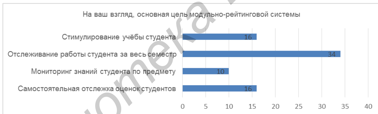
Рис. 2 - Восприятие цели МРС студентами ВУЗа

Для уточнения функций модульно-рейтинговой системы был предложен альтернативный вопрос о цели ее использования. Результаты представлены на рисунк 2.