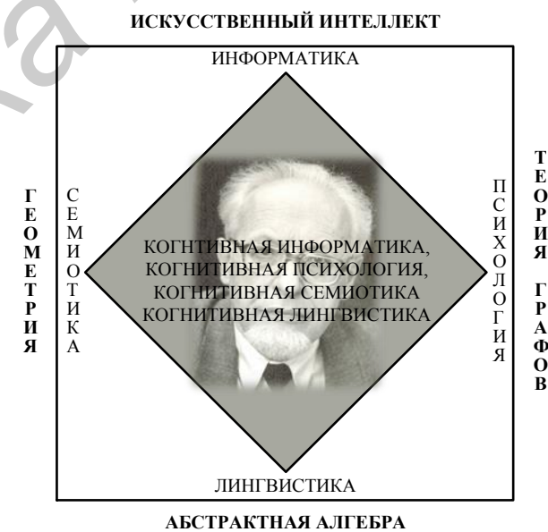
Рисунок 1 – К методологии научного исследования В.В. Мартынова

При развитии семиологического подхода к ИИ с целью создания языка представления знаний и диалога типа «Универсальный семантический код» (УСК) профессор В.В.Мартынов разработал свой вариант открытой, системной, междисциплинарной методологии, которая схематически изображена на рисунке 1. Опишем подробнее ее составляющие. Для этого приведем обоснование необходимости построения УСК как многофункционального языка. Профессор В.В. Мартынов начинает с определения проблемы в целом и общих требований к УСК [Мартынов, 1974, 1977, 2001].