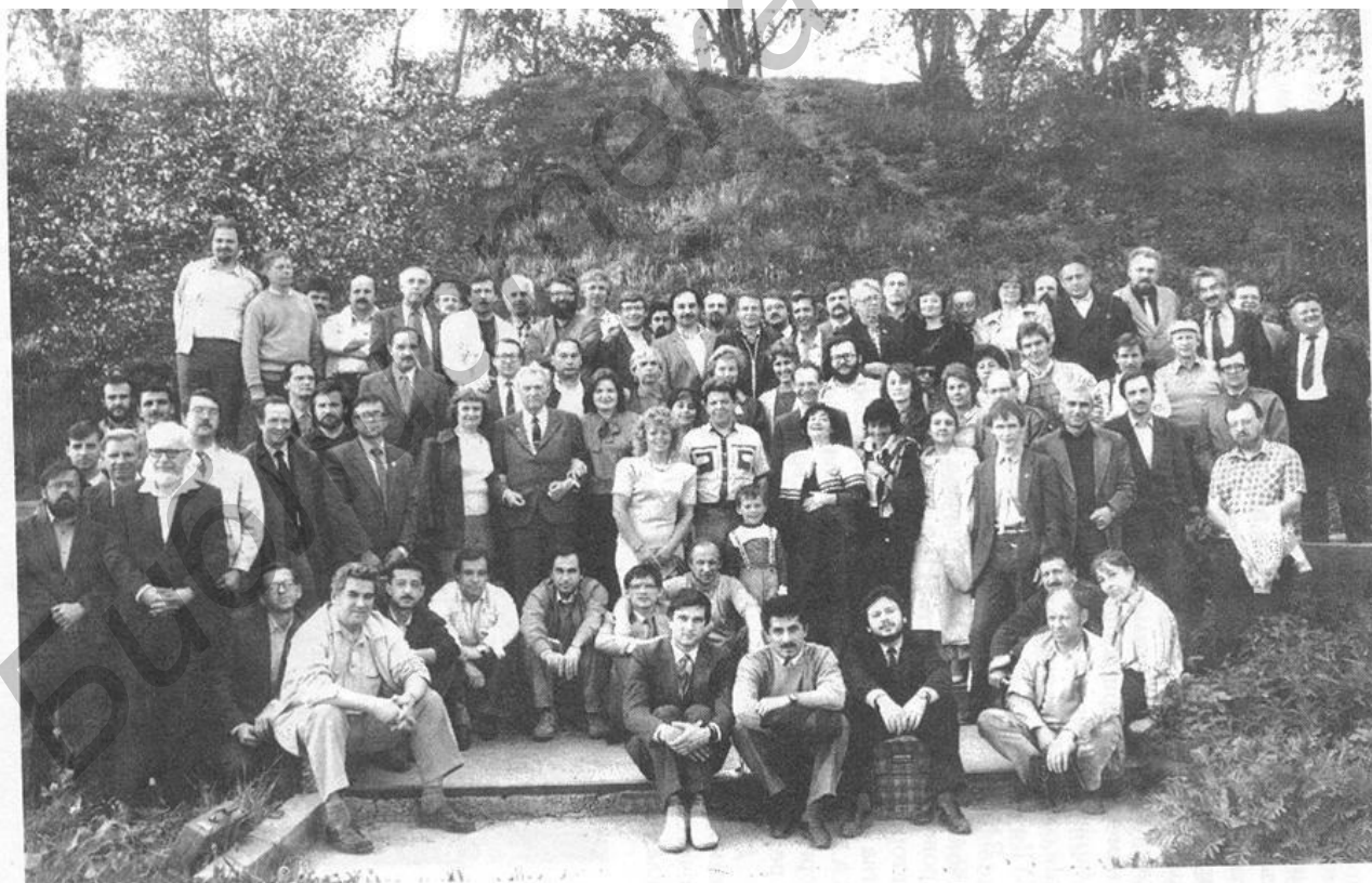
Участники учредительного съезда Советской ассоциации искусственного интеллекта

Ключевые слова: искусственный интеллект; представление знаний; семиотика; лингвистика; исчисление смыслов; универсальный семантический код; когнитивная семиотика; когнитивная информатика.