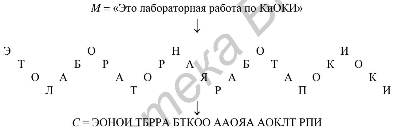
Рис. 1.1. Шифрование методом «железнодорожная изгородь»

Простейшим представителем этого множества методов является метод «железнодорожной изгороди», при использовании которого исходное сообщение преобразуется в соответствии с фигурой, напоминающей по форме железнодорожную изгородь, откуда и пошло его название. В этом случае символы исходного текста записываются в виде, напоминающем по форме забор, а символы зашифрованного текста считываются из полученной записи построчно. Пример шифрования этим методом приведен на рис. 1.1.