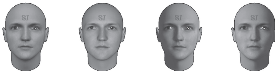
Рис. 3. Моделирование различных условий освещения