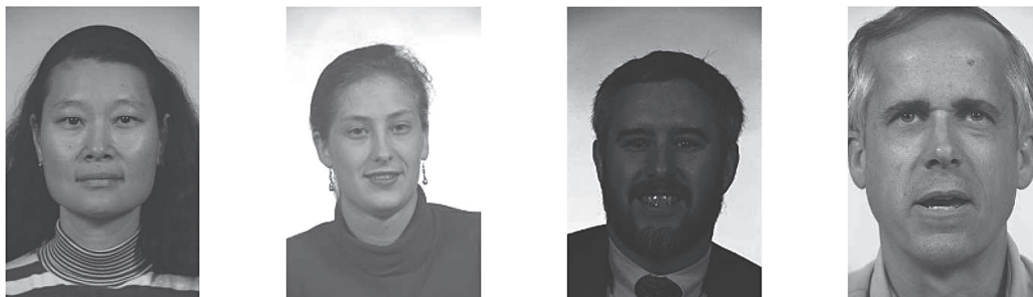
Рис.1. Образцы изображений с различной освещенностью