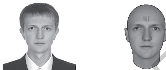
Рис. 2. Сопоставление фотографии и 3D модели

ко данная работа направлена в большей степени на моделирование шумов и не рассматривает вопросы моделирования освещения, мимики, возрастных отличий.