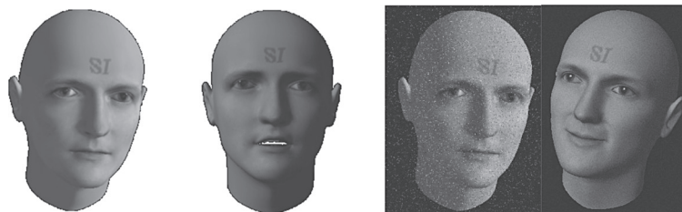
Рис. 7. Моделирование вариаций освещения, эмоций, возраста, шумов

векторов при обучении классификаторов, что повышает обобщающую способность классификаторов и, следовательно, приводит к увеличению коэффициента распознавания.