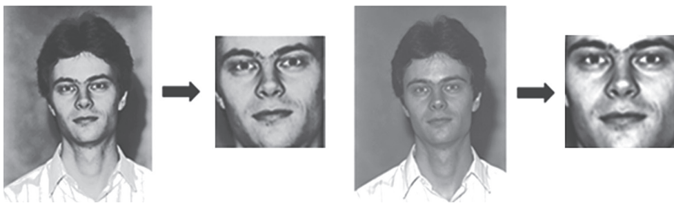
Рис. 8. Пример процедуры предобработки изображения

тора. Сохранение вектора признаков в обучающем наборе и соответствующей базе системы.