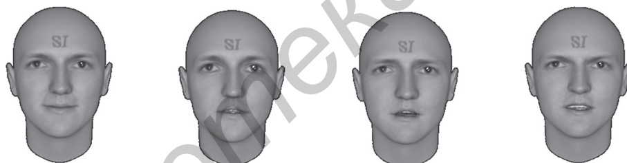
Рис. 6. Эмоции: улыбка закрытая, удивление, страх, гнев

су старения и, как следствие, изменению черт лица (рис. 4).