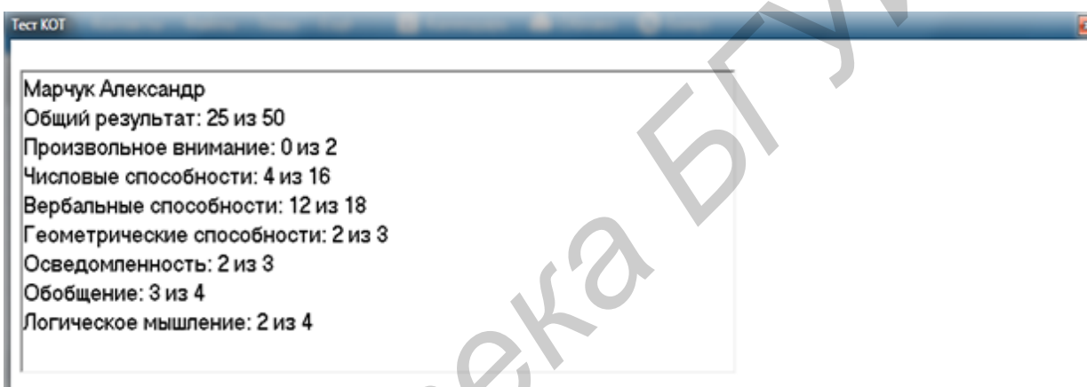
Рис.3 Скриншот результата теста

По окончании прохождения теста, нажатия кнопки «Дальше» на вопросе №50, вам будет показан ваш результат по семи шкалам отдельно и общий.