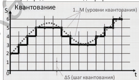
Рисунок 2 – График процесса квантования

Изменения сигнала, происходящие на каждом этапе АЦП, представлены в виде графиков.