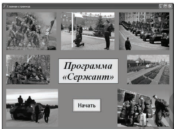
Рисунок 1 – Интерфейс программы «Сержант»

Оказать помощь им в это позволит применение на данном этапе электронно-вычислительных машин и установленных на них специально разработанной программы «Сержант» (рисунок 1).