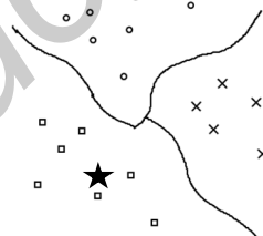
Рис. 1. Классификация в векторном пространстве

В основе использования модели векторного пространства лежит гипотеза о компактности (классы образуют компактно локализованные подмножества в пространстве объектов) [1].