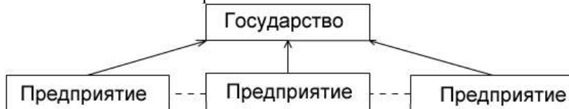
Схема 3. Хозяйственные связи в командной экономике.

При реформировании командной экономики на всем постсоветском пространстве проводили разгосударствление и приватизацию. Разгосударствление означает снятие с государства большинства функций хозяйственного управления и передачу их на уровень предприятий; происходит замена вертикальных хозяйственных связей горизонтальными.