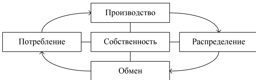
Схема 2. Место собственности в экономической системе

Присвоение — это отчуждение объекта одним субъектом от другого. Владение означает, что присвоение осуществляется в интересах собственника, а также предполагает определенные обязательства владельца перед государством и другими институтами. Пользование — фактическое применение вещи. Распоряжение — принятие решения по поводу функционирования объекта собственности (продать, подарить, сдать в аренду и т. д.).