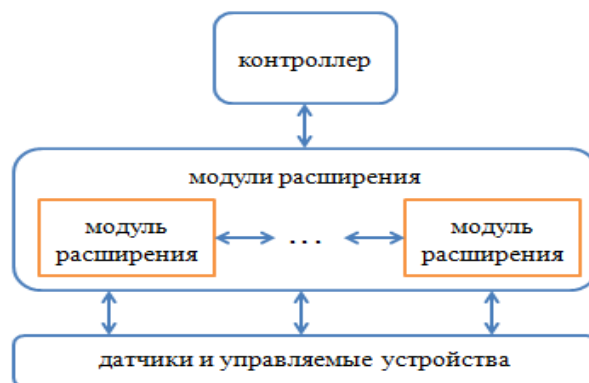
Рисунок 1 – Типовая схема аппаратного обеспечения умного дома

На рисунке 1 представлена типовая схема аппаратного обеспечения умного дома.