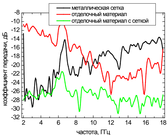
Рис. 2. Значения коэффициентов передачи материала с шунгитом в диапазоне 2–18 ГГц.