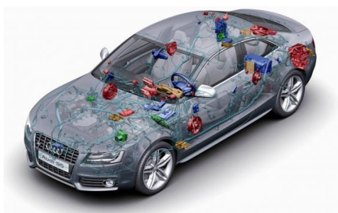
Рис. 1 – Системы автомобиля, использующие CAN интерфейс

Современный автомобиль несет на своем борту множество сложных электронных устройств. Они объединены в единую сеть для обмена данными через бортовые информационные шины — CAN (Controller Area Network) — это интерфейс передачи информации. CAN-шина в автомобиле предназначена для соединения между собой всех датчиков, блоков и электронных систем, сбора данных от них, обмена информации между ними, а также управления.