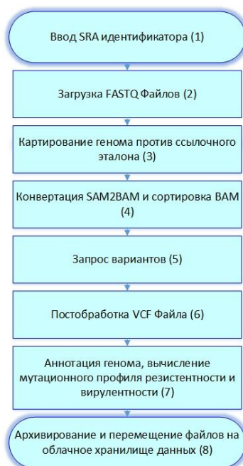
Рис. 2. Алгоритм разработанного программного обеспечения

Tools (4), Pilon (5), VT и RTG (6), BedTools и SNPEff (7), Mega.py (8). Текущая версия программного обеспечения способна вычислять мутации в 40 генах резистентности и 20 – вирулентности (см. табл. 2 и 3).