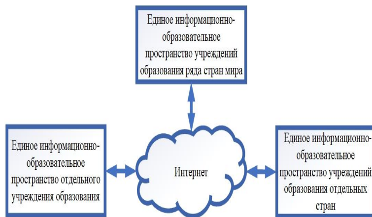
Рисунок 1– Общая структура взаимосвязи ЕИОП разных уровней иерархии