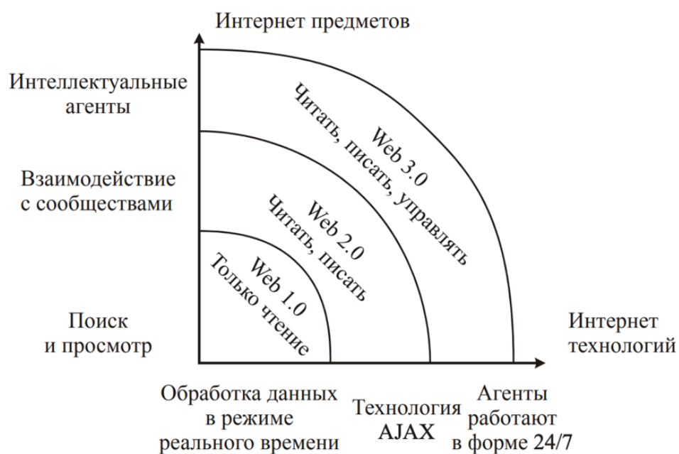
Рисунок 1 – Этапы развития интернета

Интернет является рекордсменом по скорости распространения среди когда-либо существовавших средств массовой информации. Чтобы охватить 25% населения США, телефону понадобилось 35 лет; телевидению – 26 лет; радио – 22 года; а мобильной связи – 13 лет. Интернет сделал это всего за 7 лет, при этом в США процесс интернетизации нельзя назвать самым быстрым, но там хорошо ведется статистика развития интернета. Вся интернет-статистика постоянно обновляется, но различные источники дают разные цифры. За 2017 год доступ к интернету получили 250 млн человек, и количество интернет-пользователей впервые в истории превысило 4 миллиарда. Во многом такому росту поспособствовали доступные смартфоны - в этом году 200 млн человек приобрели свое первое мобильное устройство.