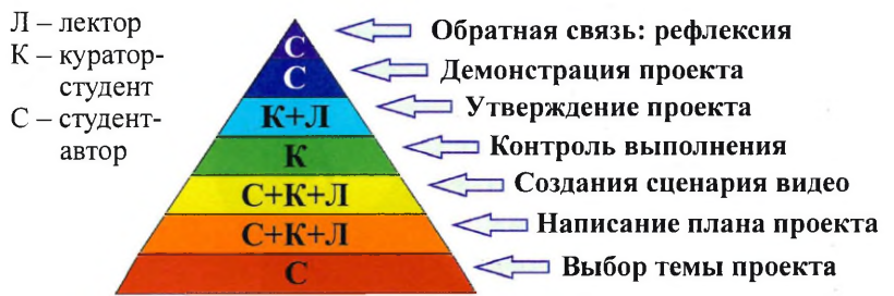
Рис. 4. Диаграмма, иллюстрирующая этапы создания творческих проектов по физике

Рассматривая современные эффективные технологии обучения в вузах, особое внимание следует уделять организационным формам эвристического обучения как одного из способов индивидуализации образования [4, с. 21], направленного на раскрытие и реализацию потенциала учащегося. При творческом обучении благодаря применению эври-