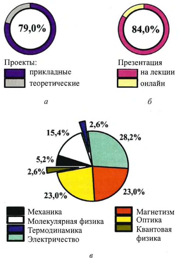
Рис. 5. Анализ характера (а), способа подачи (б) и тем (в) творческих проектов по физике участников педагогического эксперимента

Внедрение авторской технологии организации лекционных занятий по общей физике является примером продуктивного сотворчества преподавателя-лектора и студентов-авторов, что оказалось возможным благодаря применению элементов эвристического обучения, повышающих эффективность лекций. Создание творческих работ как образова-