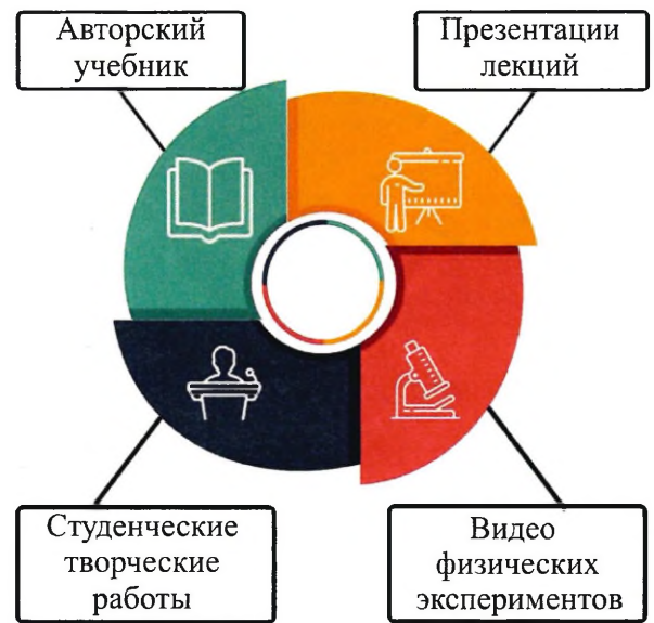
Рис. 1. Структура авторской технологии организации лекционных занятий по общей физике

Апробация технологии организации лекционных занятий по общей физике с элементами эвристического обучения была выполнена на факультете компьютерных систем и сетей (ФКСиС) в Белорусском государственном университете информатики и радиоэлектроники (БГУИР) г. Минска. Результатом внедрения стало создание студентами IT-специальностей цикла творческих работ по физике в форме видеороликов.