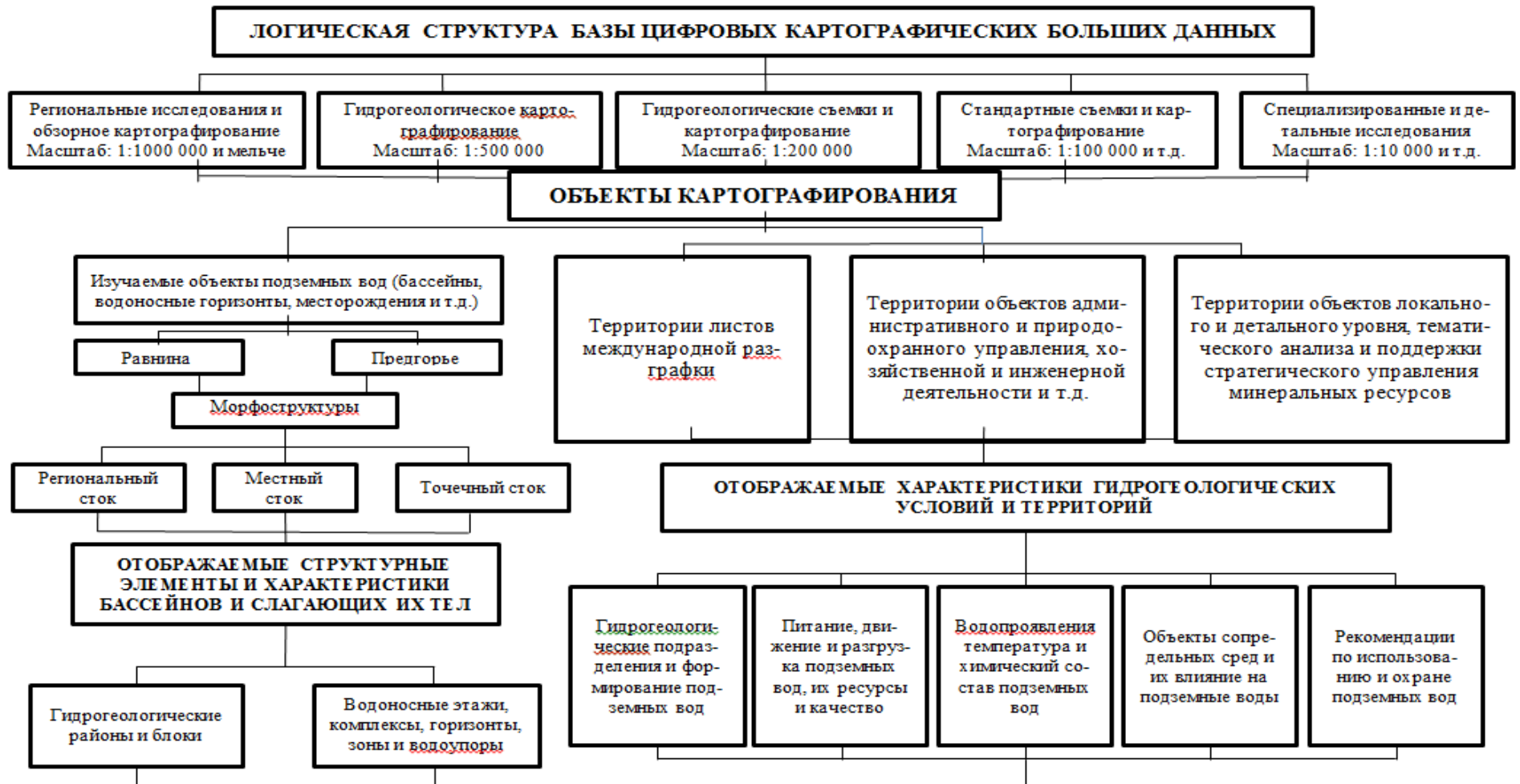
Рисунок 3. Схема логической структуры гидрогеологической картографической базы больших данных.