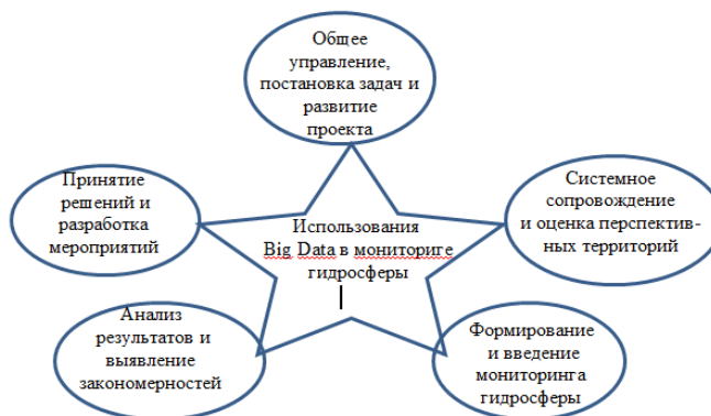
Рисунок 1. Процесс использования Big Data в жизненном цикле управления мониторингом подземных вод

Этап планирования исключительно важен, так как именно он определяет, какие работы требуются, какое именно оборудование необходимо использовать для этого. К примеру, неправильно проведенные исследования могут привести к получению искаженных результатов. Именно на этапе планирования изысканий должна формулироваться логическая структура больших баз данных (рисунок 3), которая может выполняться только опытным специалистом, составляется общий план работ [8. 9].