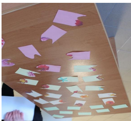
Рис. 2. Раскладка билетов к мини-квесту «Найди пару»

Правила мини-квеста будут позднее объявлены ведущими. Билеты квеста, подготовленные для распечатки, приведены на ссылке. К ним добавляются билеты для интерактивного театра (приложены на ссылке). Предварительно все билеты распечатываются. С одной стороны у них должна получиться картинка, с другой – текст. Может быть использована цветная бумага кроме белой, если участников больше, чем подготовленных билетов. В этом случае каждый дополнительный цвет бумаги будет давать дополнительный комплект билетов. После распечатки билеты разрезаются для получения пары, перемешиваются и раскладываются картинкой вверх на поверхности стола для выбора участниками (рис. 2). Модераторы должны отследить, чтобы билеты с цифрами вместо текста (билеты для интерактивного театра) обязательно были выбраны. Их подвигают в наиболее удобную зону, используя техники мерчандайзинга.