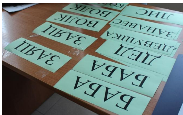
Рис. 6. Таблички для интерактивного театра

Для реализации интерактивного театра заранее готовятся таблички с названием ролей (приведены на ссылке), нарезаются и раскладываются на столе (рис. 6), распечатка таблицы, раскодирующей цифры на роли (на ссылке). Каждой цифре на билете соответствует своя роль. Это нужно для того, чтобы ускорить процесс подготовки артистов к выступлению и исключить споры, разногласия о том, кому какую роль играть. Действует принцип: «Той билет – твоя цифра – твоя роль».