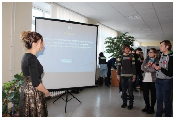
Рис. 5. Проведение своей игры «ВИЧ-инфекция. Что ты заешь о ней?»

Данная разработка может быть использована отдельно для более мелкого воспитательного мероприятия (например, кураторского часа), проводиться как соревнование между командами для привлечения всех учащихся.