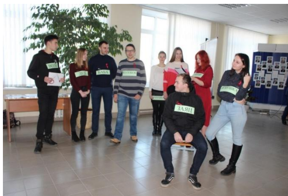
Рис. 7. Сцена интерактивного театра

Обычно такая форма воспитания, как интерактивный театр, вызывает бурю положительных эмоций у зрителей, которые внимательно следят за действиями актеров, пытаются им подсказывать и помогать. Реплики зрителей не запрещены, но излишний шум не приветствуется. При необходимости автор делает зрителям замечание или просит поощрить актера (актеров) аплодисментами.