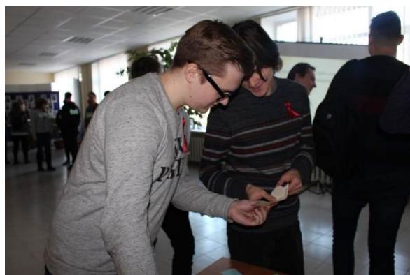
Рис. 3. Фото процесса поиска пары

Вторая зона – интеллектуальная викторина в технике своей игры «ВИЧ-инфекция. Что ты знаешь о ней?». Соревнование проводится между отдельными участниками. Модератор ведет игру. Его помощник фиксирует результаты.