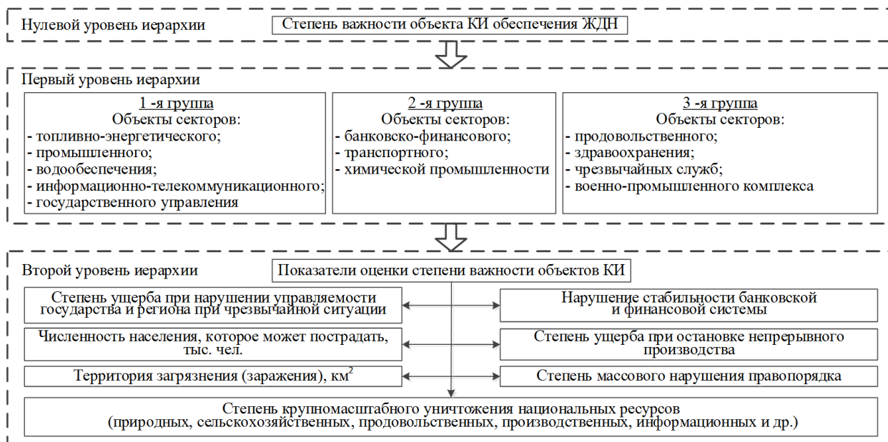
Рисунок 2. – Структурная схема иерархии степени важности объектов КИ обеспечения жизнедеятельности населения

Приоритеты частных показателей элементов иерархии 1-го уровня определяются из матрицы попарных сравнений относительно цели 0-го уровня. Приоритеты показателей элементов иерархии 2-го уровня определяются из матриц попарных сравнений 2-го уровня относительно показателей элементов иерархии 1-го уровня, а затем полученные столбцы приоритетов 2-го уровня иерархии взвешиваются путем перемножения матрицы, составленной из столбцов-приоритетов 2-го уровня, на матрицу-столбец приоритетов 1-го уровня.