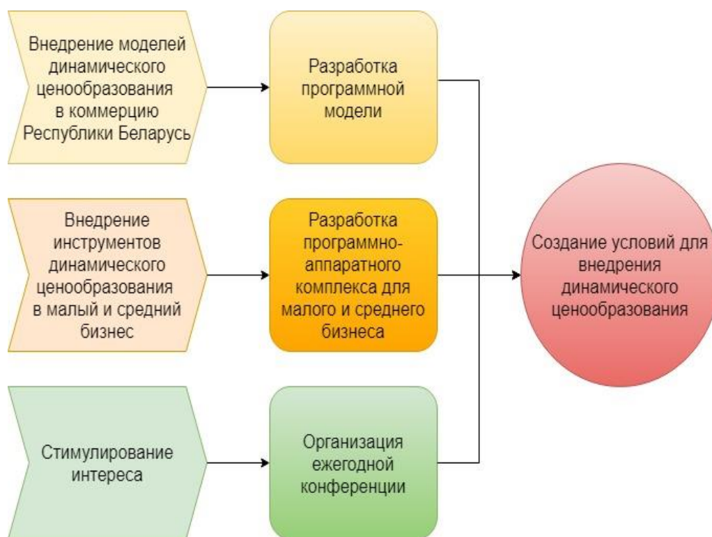
Рисунок 2 – Система разработанных мероприятий

Приведенные мероприятия позволяют достичь общую цель – создать инфраструктуру для развития динамического ценообразования и использования его инструментов в Республике Беларусь. Это наглядно продемонстрировано на рисунке 2.