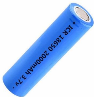
Рисунок 2 – Блок суперконденсаторов, солнечный модуль и литий-ионная батарея

Данный эксперимент показал, что использование комбинированного метода является перспективным для фотоэлектрических систем. Однако, есть нюансы: