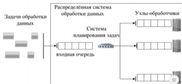
Рис. 1 – Схема кластерной системы

Grid создается на базе вычислительных кластеров. Кластер представляет собой совокупность компьютеров, объединенных локальной сетью и предназначенных для решения ресурсоемких (по процессорному времени, оперативной памяти и памяти на жестких дисках) вычислительных задач, и относится к классу многопроцессорных вычислительных систем. Схематично кластерная система изображена на Рис 1.