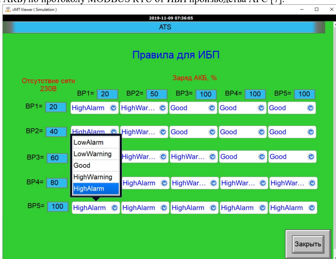
Рис. 2. Экранная форма для ИБП

На рисунке 2 показан интерфейс экранной формы, обеспечивающей считывание и масштабирование двух параметров (сетевое напряжение на входе ИБП и процент заряда АКБ) по протоколу MODBUS RTU от ИБП производства APC [7].