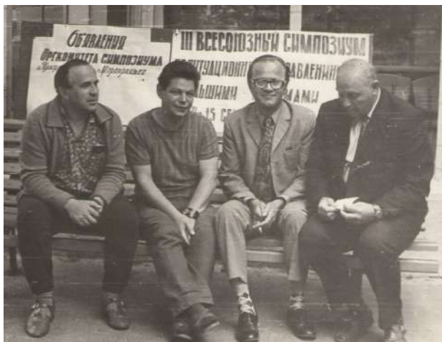
Рис. 8. Д.А.Поспелов с участниками III-го Всесоюзного симпозиума по ситуационному управлению большими системами в Одессе

Ситуационное управление требуется для класса больших (или сложных) систем, таких как город, морской порт, транснациональное предприятие, где невозможна или нецелесообразна формализация процесса управления в виде математических уравнений, а доступно лишь его описание в виде последовательности предложений естественного языка с помощью логико-лингвистических моделей. На основе экспертной информации строится классификатор, позволяющий разделять все наблюдаемые ситуации на нечёткие классы (образующие покрытие, но не разбиение). Для описания ситуаций используются семантические сети и близкие к ним модели знаний.