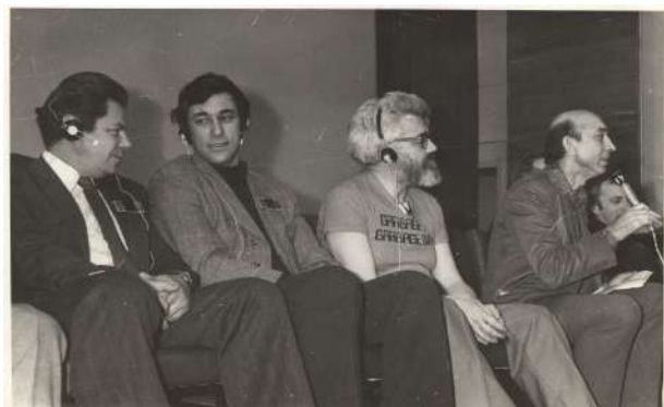
Рис. 10. На Международном совещании по искусственному интеллекту в Репино. Справа налево: вопрос задаёт Л. Заде, рядом с ним сидят: Дж. Маккарти, В. И. Варшавский, Д. А. Поспелов.

впервые на английском языке были подробно описаны недостатки классической теории автоматического управления как предпосылки появления ситуационного управления, сам метод ситуационного управления и его приложения.