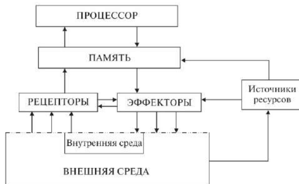
Рис. 12. Модель «организм – среда» как структура простейшего агента

В предисловии к книге «От моделей поведения к искусственному интеллекту» [48], в которой продолжено исследование проблем, затронутых М. Г. Гаазе-Рапопортом и Д. А. Поспеловым, отмечено, что монография [30] сыграла существенную роль в развитии наук о поведении, став предвестником интересного и перспективного научного направления «Моделирование адаптивного поведения».