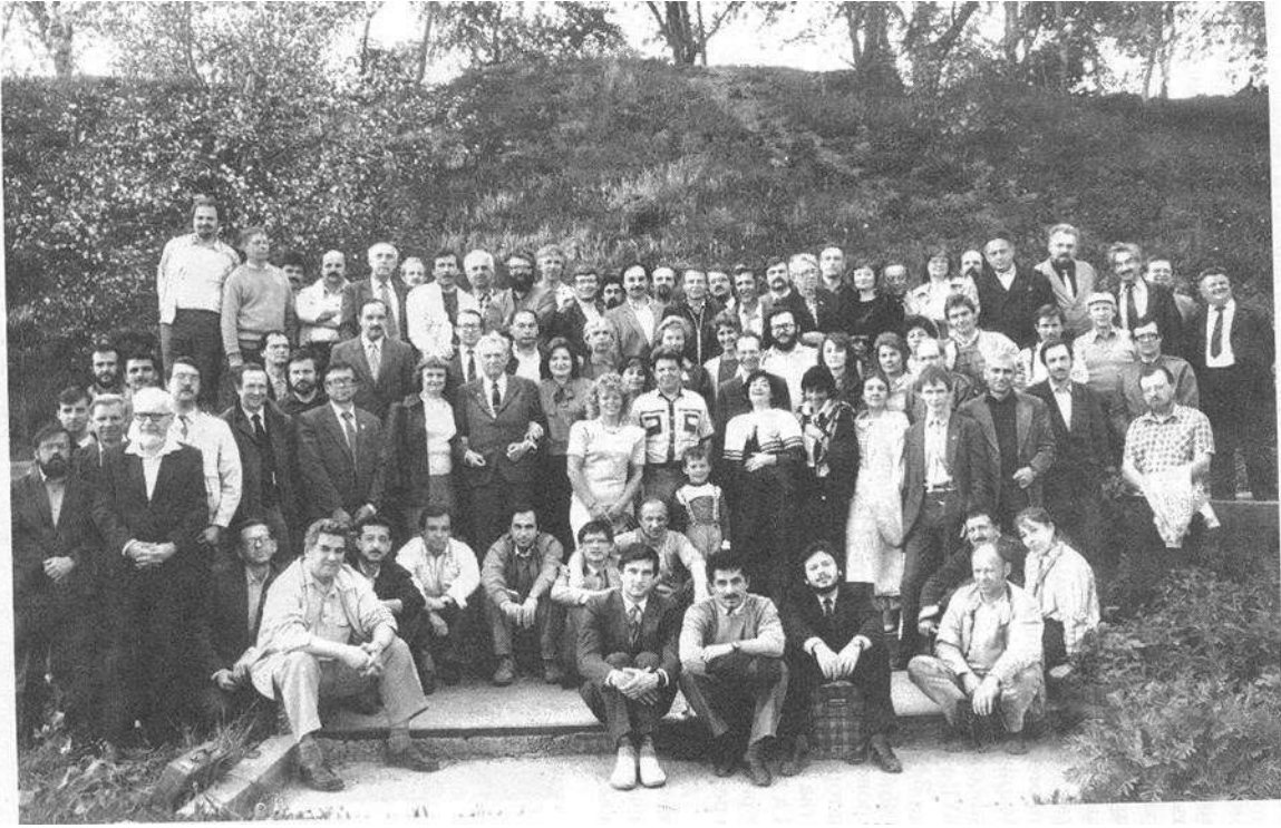
Рис. 1. Посвящается участникам учредительного съезда Советской ассоциации искусственного интеллекта