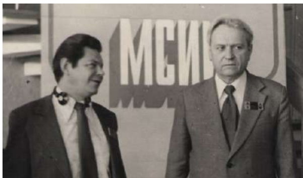
Рис. 9. Академик Г. С. Поспелов и профессор Д. А. Поспелов на Международном совещании по искусственному интеллекту в Репино (1977 г.).