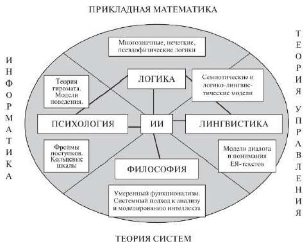
Рис. 11. Искусственный интеллект — синтетическая «наука-перекресток»

являются методы и средства прикладной математики (включая прикладную логику), теории систем, теории управления, информатики и вычислительной техники, программирования [24]. На рис.11 приведена общая иллюстрация представлений Д. А. Поспелова об ИИ как «системе наук» (см. также [25]).