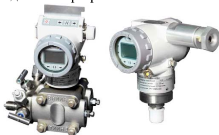
Рис. 1. Датчики давления серии ТЖИУ406-М100

При разработке ставка делалась на уникальные параметры датчиков, которые значительно превосходят показатели других производителей: