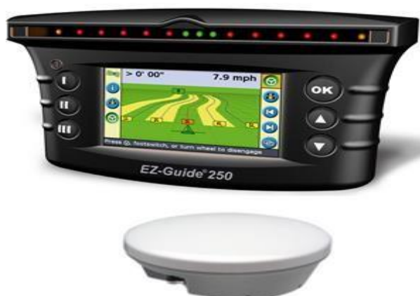
Рисунок 2. –Устройство параллельного вождения Trimble EZ-Guide 250

На рисунке 2 представлено Устройство параллельного вождения Trimble EZ-Guide 250.