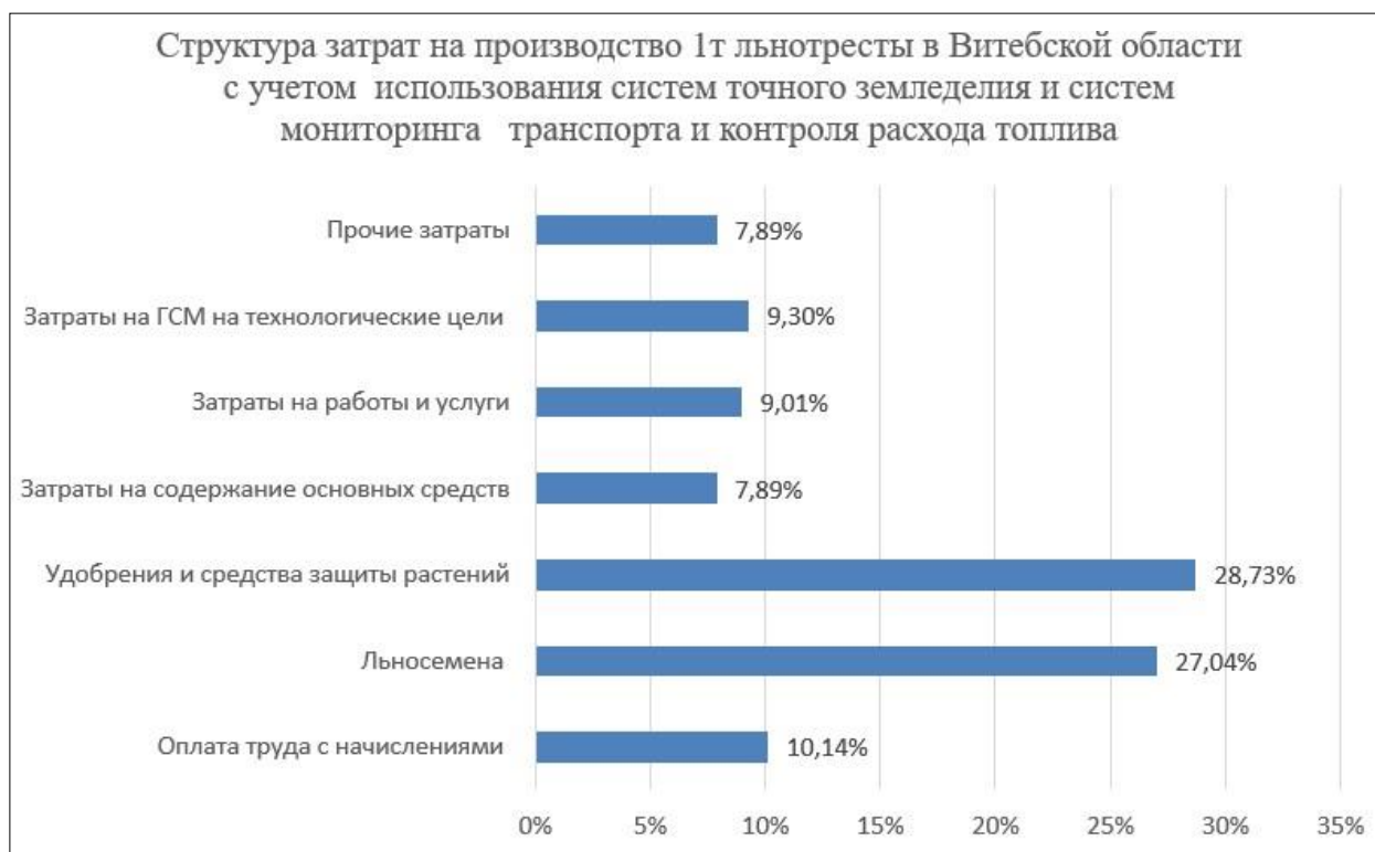
Рисунок 5. – Структура затрат на производство льнотресты с учетом использования систем точного земледелия и систем мониторинга транспорта, и контроля расхода топлива

При использовании систем точного земледелия и систем мониторинга транспорта, и контроля расхода топлива следует ожидать незначительное перераспределение структуры затрат.