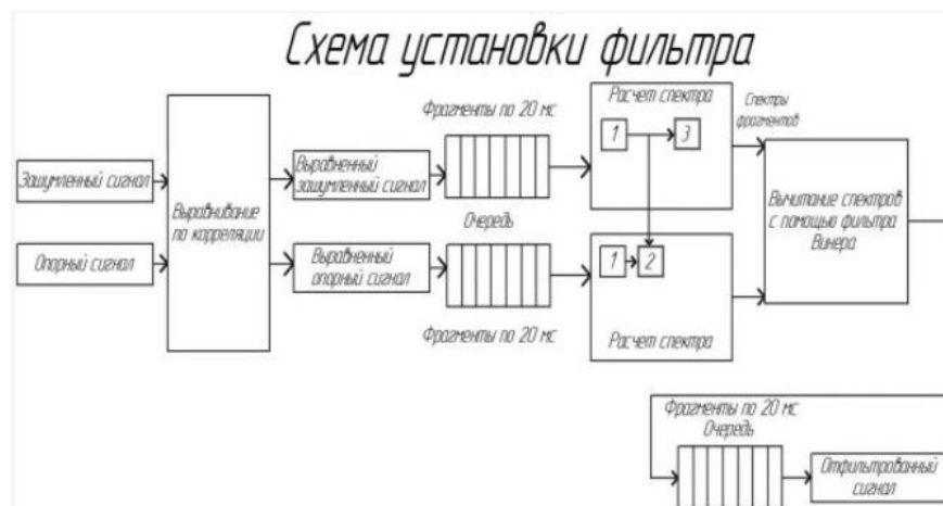
Рисунок 1. Схема установки фильтра

Алгоритм шумоподавления является сочетанием нескольких приемов шумоподавлений: применение двух микрофонов, выравнивание сигналов разных микрофонов по корреляции, учет сдвига фаз между гармониками сигналов разных микрофонов для дополнительной фильтрации шумов, динамический расчет усредненного спектра шума по текущему фрагменту обрабатываемого сигнала, фильтр Винера для вычитания спектров [2] .