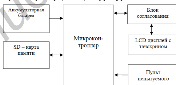
Рис. 1. Структурная схема прибора МПП

Для обеспечения мобильности измерения оценки способности к корректировке решения и определения времени реакции человека на движущийся по направлению от него объект, был разработан микропроцессорный прибор (МПП), структурная схема которого приведена на рис. 1.