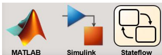
Рисунок 1 – Логотипы основных инструментов пакета MATLAB

Логотипы данных инструментов представлены на рисунке 1.