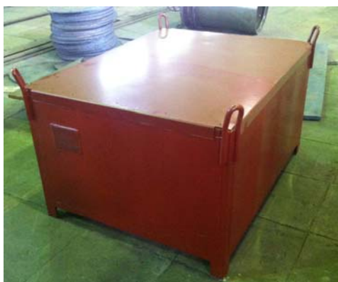
Рис. 1. Упаковочный контейнер

Разработано программное обеспечение паспортизатора, которое обеспечивает: контроль движения измерительной части вдоль контейнера, набор и обработку спектров гамма-излучения со всех блоков детектирования измерительной части паспортизатора, идентификацию радионуклидов и определение их удельной активности, сохранение измерений в базе данных и формирование паспорта контейнера с РАО. В измерительной части паспортизатора применяются интеллектуальные спектрометрические блоки детектирования гамма-излучения БДКГ-205м, специально разработанные на УП «АТОМТЕХ». Габаритные размеры упаковочных контейнеров: 1320×1032×740 мм. Контейнер представляет собой стальной каркас, облицованный листами стали толщиной 2 мм. На рис. 1 приведена фотография упаковочного контейнера.