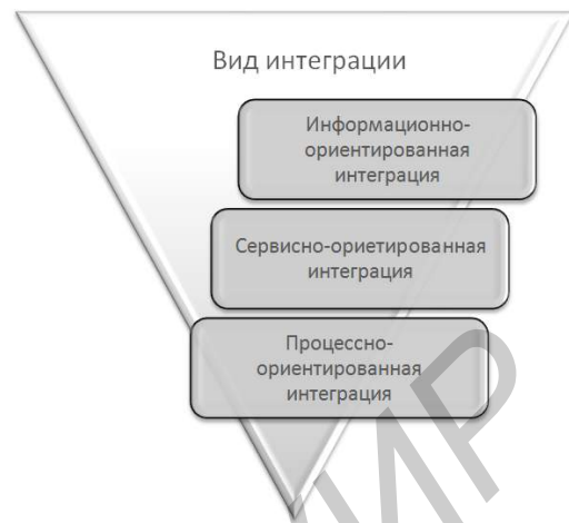
Рисунок 1 - Виды интеграции информационных систем

В настоящее время выделяют несколько видов интеграции информационных систем (рис. 1) [Франгулова, 2010].