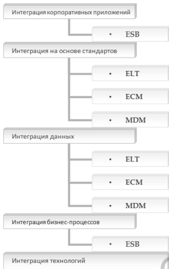
Рисунок 2 - Классификация интеграционных уровней и соответствующие им технологии

интеграция приложений, интеграция бизнес-процессов, интеграция на основе стандартов и интеграция платформ (рис. 2).