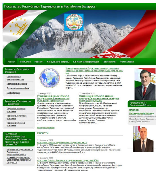
Рисунок 1 – клиентская часть сайта tajembassy.by

Веб-приложение реализовано в виде трёхуровневой системы и включает клиентскую, серверную части и базу данных. Для клиентской части взят и модифицирован бесплатный HTML шаблон vizew (рисунки 1).