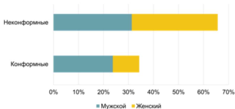
Рисунок 1. Соотношение конформных и неконформных ответов респондентов

В результате проведенного исследования было установлено, что из тех вопросов, когда подставная группа дает заведомо ложные ответы, 34% ответов были конформные. При этом почти 70% конформных ответов были даны юношами (Рис.1).