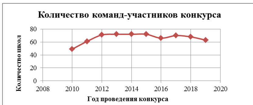
Рис.2. Статистика участия в Городском конкурсе «Мой профессиональный выбор»

Ежегодно в конкурсе принимает участие около 600 обучающихся школ города.