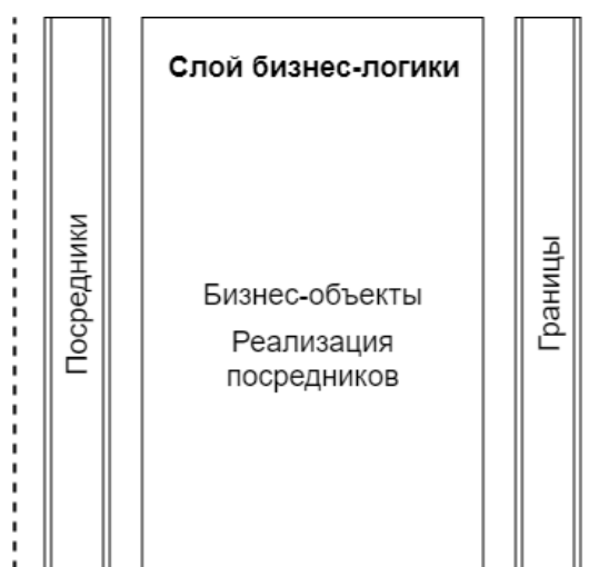
Рисунок 2 – Схема слоя бизнес-логики

На слое бизнес-логики реализованы посредники, с помощью которых обновляется графический интерфейс приложения. Вся логика приложения находится в этом слое и не имеет никаких Android-зависимостей, вся логика реализована на чистой Java. Все внешние компоненты для связи с бизнес-объектами используют интерфейсы. Схема данного слоя представлена на рисунке 2.