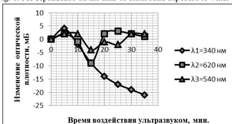
Рис. 2. Зависимости изменений оптической плотности воды на различных длинах волн ( \lambda_1 - \lambda_3 ) от времени воздействия на воду ультразвуком.