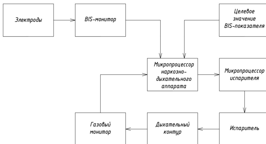
Рис. 2. Структурная схема метода автоматизированной регулировки уровня дозировки летучего анестетика для поддержания заданного значения седации

Если мониторируемый параметр входит в целевую разбежку BIS-индекса, то дозировка летучего анестетика не меняется. В случае когда седация недостаточна (BIS-параметр излишне высокий), микропроцессор аппарата посылает соответствующую команду на микропроцессор испарителя, который, в свою очередь, увеличивает дозу подаваемого летучего анестетика в дыхательный контур. И наоборот, при избыточном угнетении сознания (низкий BIS-индекс) должна подаваться соответствующая команда о снижении дозы летучего анестетика. Таким образом, осуществляется принцип автоматической регулировки и поддержания определенного уровня хирургической стадии анестезии через дозирование летучего анестетика в зависимости от биспектрального индекса. Степень изменения дозы летучего анестетика зависит от того или иного вида препарата, а также степени отклонения BIS-показателя от заданной величины.