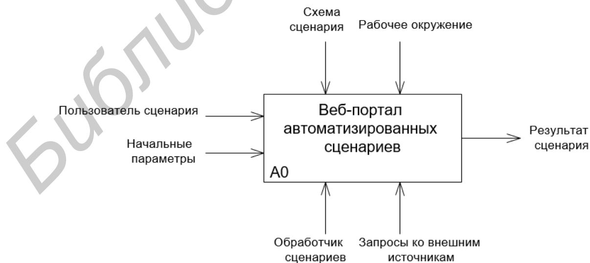
Рисунок 1 – Разработанная диаграмма IDEF0 для автоматизированной системы пользовательских сценариев

Во второй главе описывается моделирование предметной области с ее описанием. Ключевыми моментами данной главы являются проектирование модели приложения через различные диаграммы (IDEF0, вариантов использования). Кроме того, данная глава описывает правила декомпозиции диаграммы IDEF0, которая изображена на рисунке 1. Данная часть представляет наиболее из важнейших шагов при построении системы, так как правильно созданные диаграммы IDEF0 верхнего уровня помогут корректно сделать декомпозицию системы на более низких уровнях.