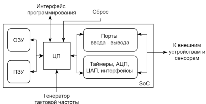
Рисунок 2 – Структура системы на кристалле

Системы на кристалле должны обладать определенным набором характеристик, специфичных для сферы применения встраиваемой системы. Такие спецификации могут, например, включать в себя разрядность процессорного ядра, возможность работы в режиме пониженного энергопотребления, требования к архитектуре микроконтроллера, поддержку определенных интерфейсов, наличие таймеров, АЦП и остальной периферии. В таблице 2 приведены часто используемые распространенные архитектуры микроконтроллеров.